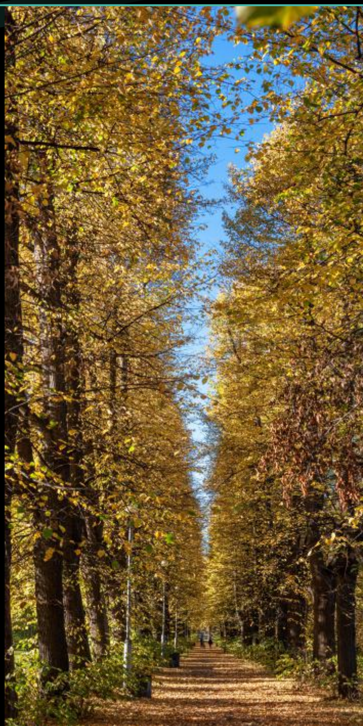
Aleja w Parku Steffensów / Steffensons' Park Avenue

A view from the windows shows a Green Park – established in the end of the 20th century. This green point on the map of the centre of Gdańsk is more than three hectares. On the other side of the Linden Avenue ( Aleja Lipowa ) there is a Steffensons' Park , one of the biggest and oldest city parks. This place is famous for its amazing plants, old trees and chestnut and elm alleys.