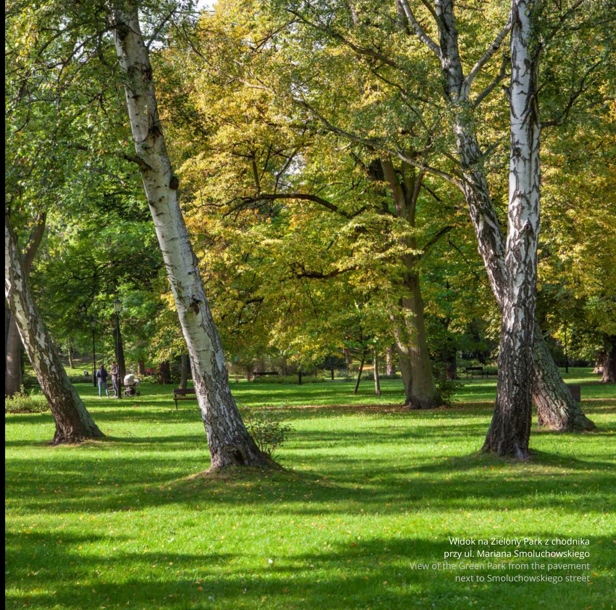
Widok na Zielony Park z chodnika przy ul. Mariana Smoluchowskiego View of the Green Park from the pavement next to Smoluchowskiego street