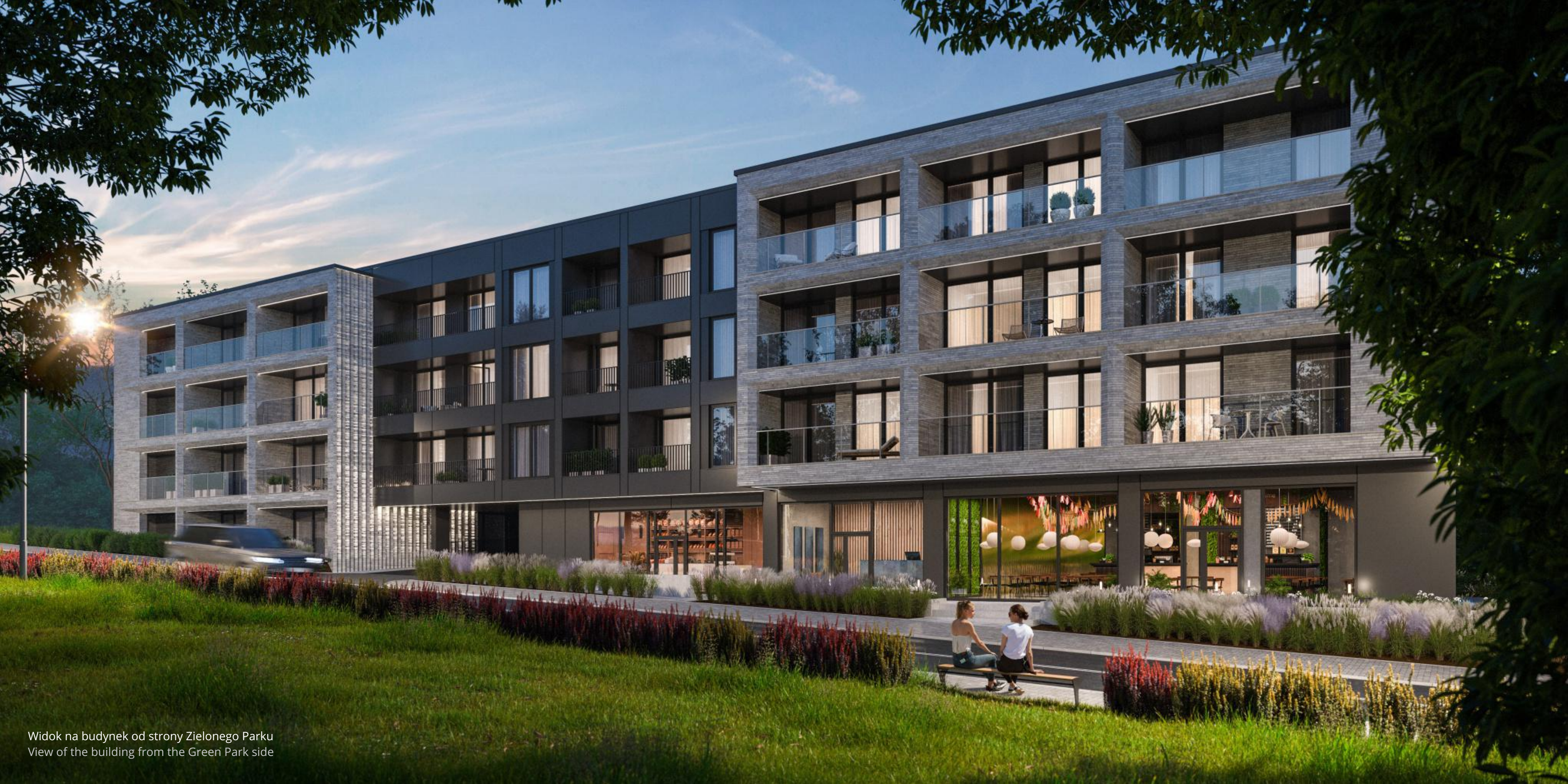
Widok na budynek od strony Zielonego Parku View of the building from the Green Park side