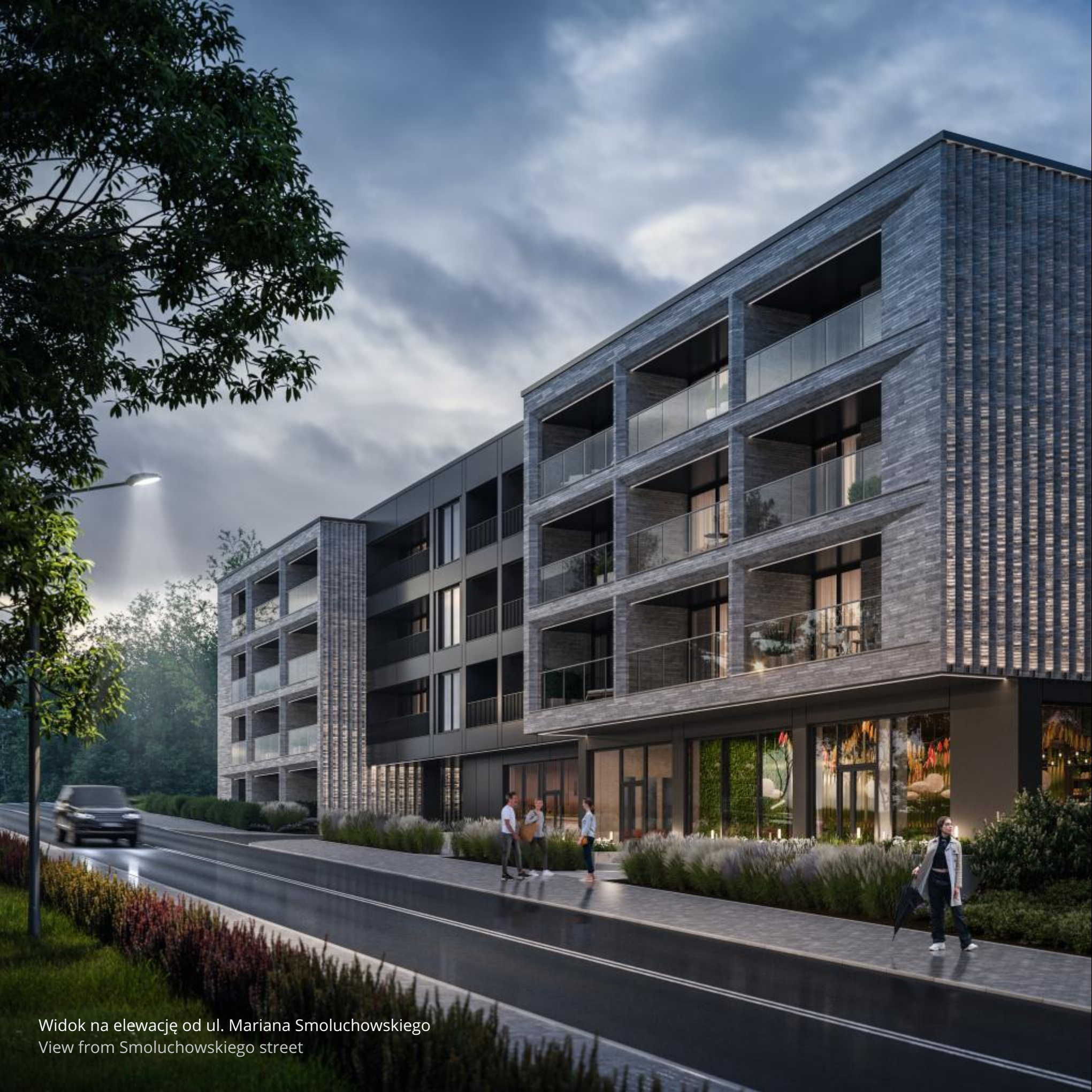
Widok na elewację od ul. Mariana Smoluchowskiego View from Smoluchowskiego street