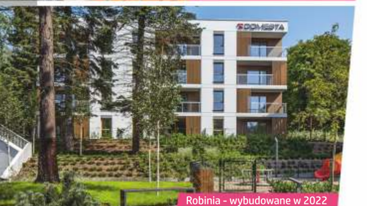
Robinia - wybudowane w 2022