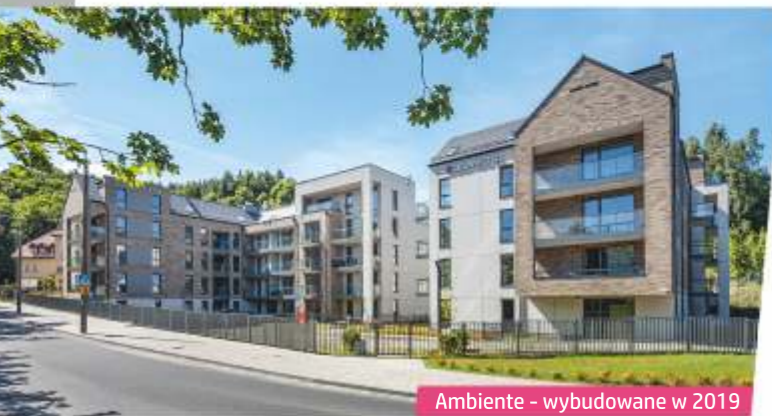
Ambiente - wybudowane w 2019