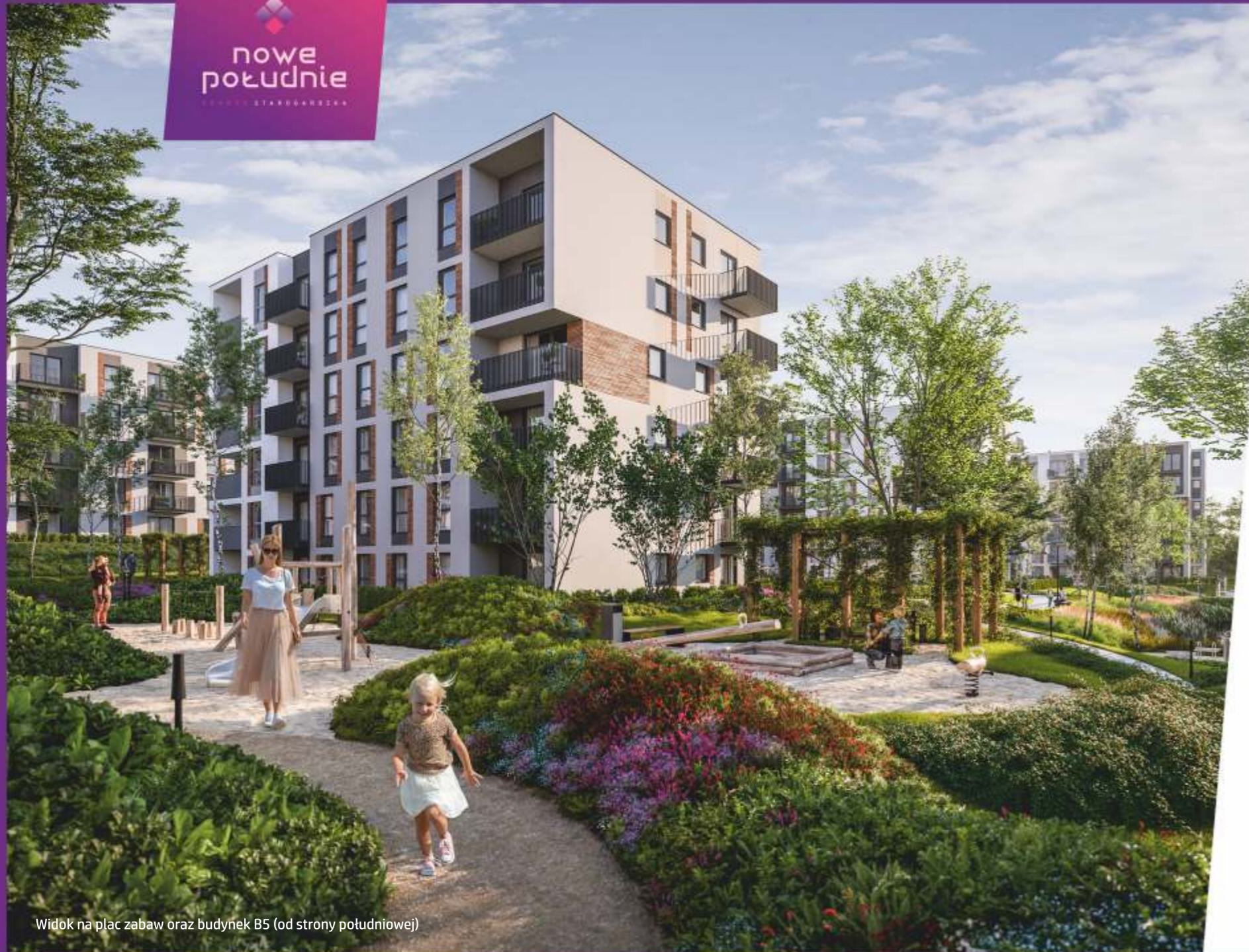
Widok na plac zabaw oraz budynek B5 (od strony południowej)