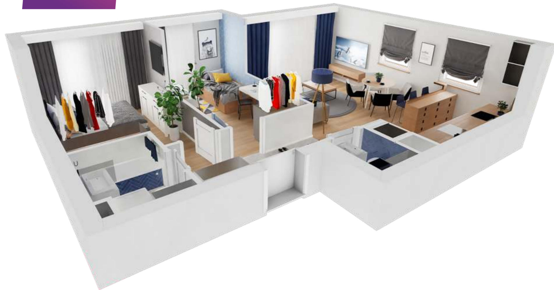
3-pokojowe / 1.A.12 61,29 m 2