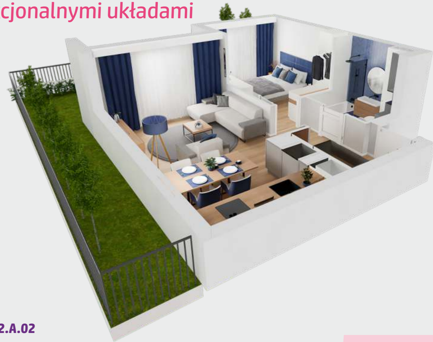
2-pokojowe / 2.A.02 47,77 m 2