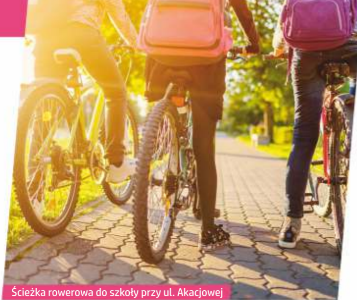
Ścieżka rowerowa do szkoły przy ul. Akacjowej

Południowa Obwodnica Gdańska – 4 minuty Trakt świętego Wojciecha – 4 minuty SPA – 4 minuty Siłownia – 5 minut Przychodnia – 6 minut Klub tenisowy i squash – 6 minut Przychodnia weterynaryjna – 6 minut Szkoła muzyczna – 7 minut Zbiornik retencyjny Augustowska – 7 minut Centrum handlowe – 8 minut Pływalnia – 9 minut Gdańsk – Głównie Miasto – 10 minut