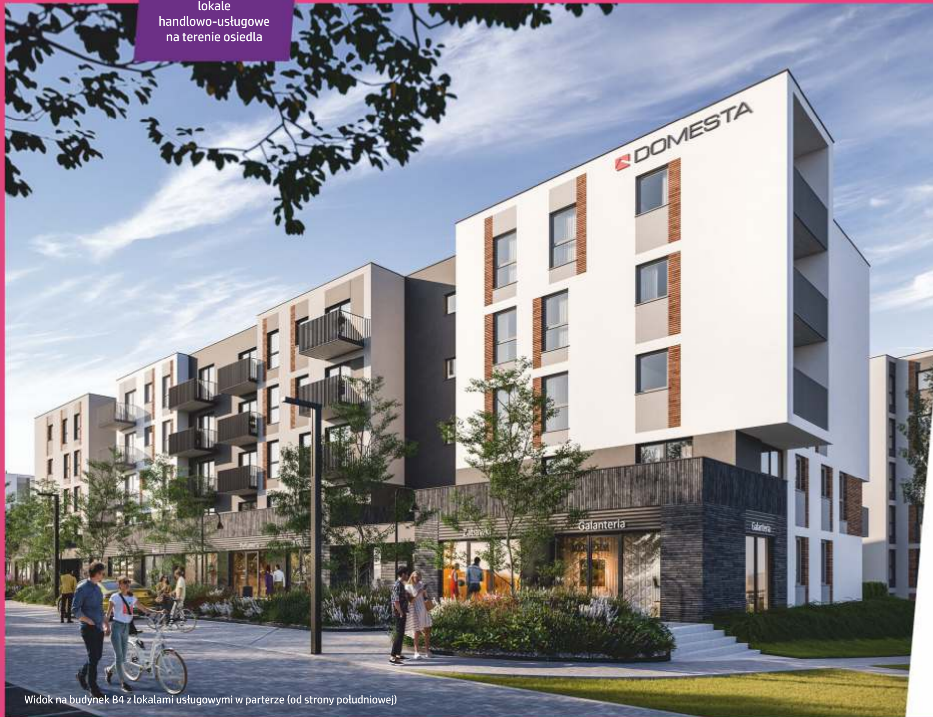
Widok na budynek B4 z lokalami usługowymi w parterze (od strony południowej)

lokale handlowo-usługowe na terenie osiedla