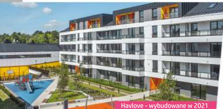
Havlove - wybudowane w 2021