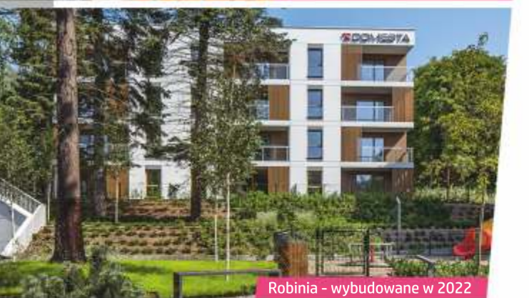
Robinia - wybudowane w 2022