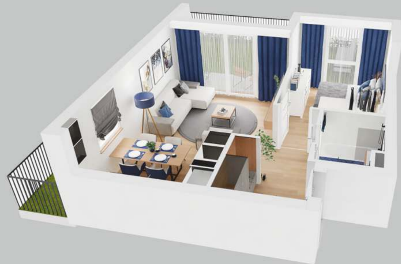
2-pokojowe / 2.A.02 47,77 m 2