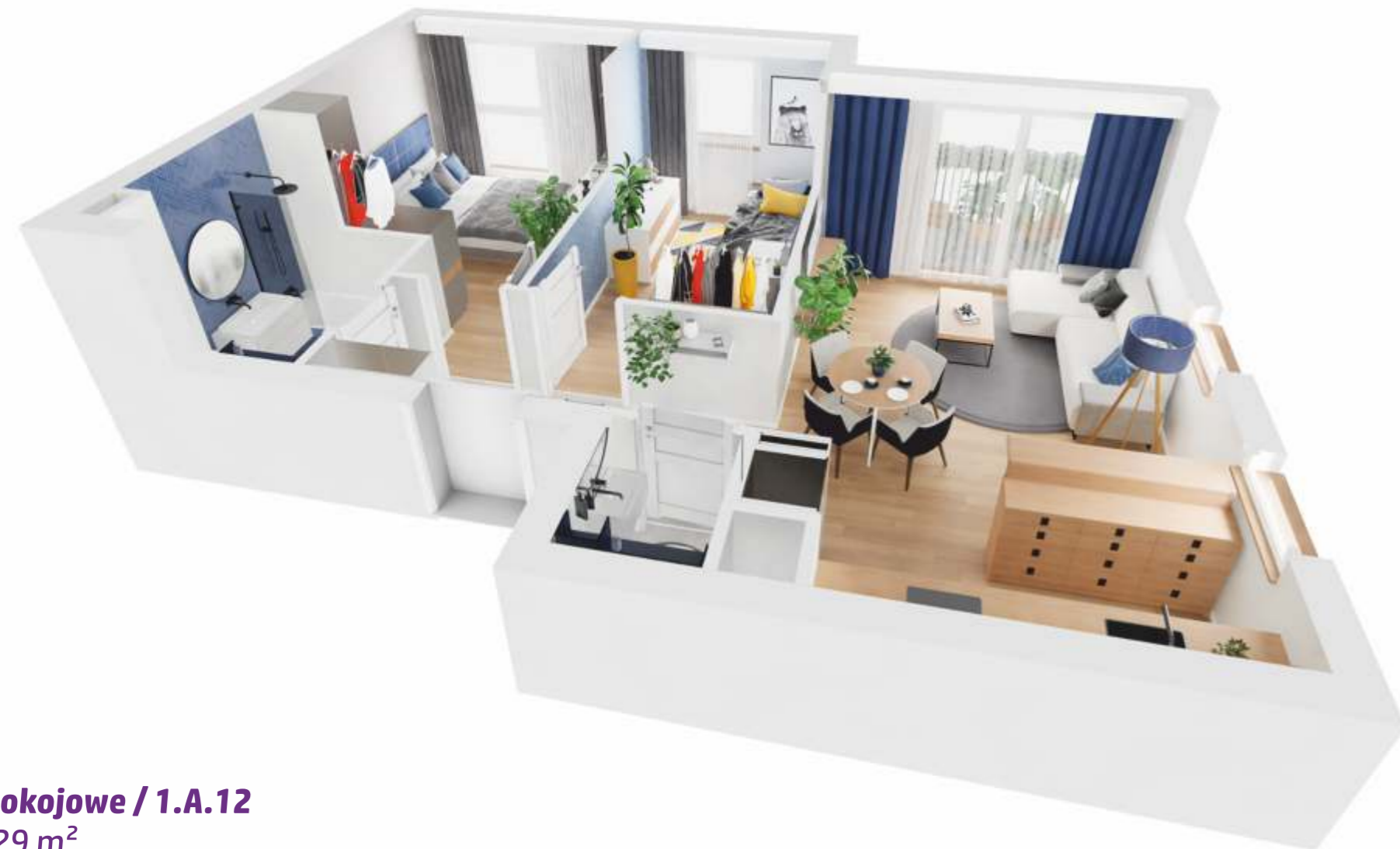
3-pokojowe / 1.A.12 61,29 m 2